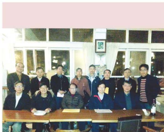
● 第四次籌備會議（清大蘇格攝底覽整）