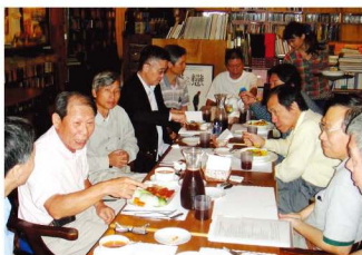
● 第三次籌備會議（清大蘇格貓底餐廳）