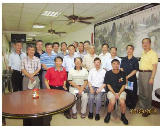
● 第一次籌備會議會後聚餐合影

召集人，接下重任，並於謝前總召指導下召開本次會議，請各位老師、學長暨同學共同協助籌辦此次大會。